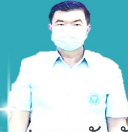
ข่าวประชาสัมพันธ์